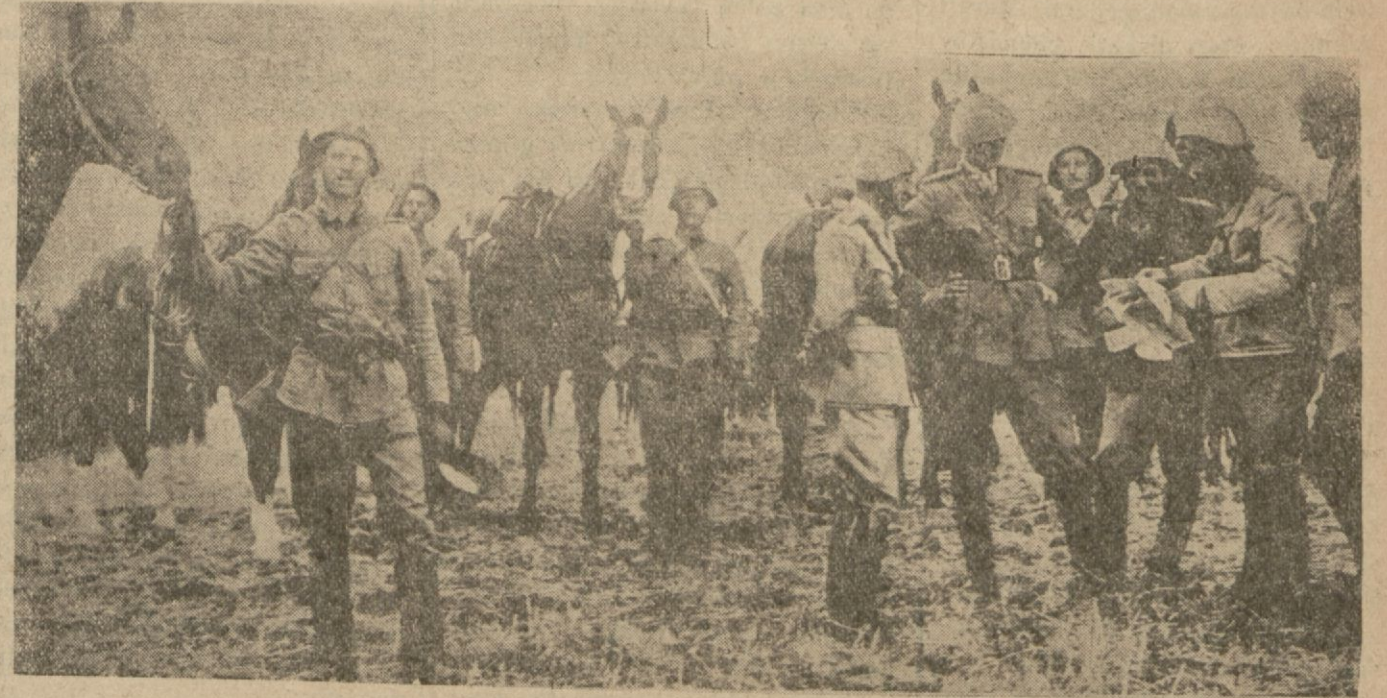
Yunan suvari kıtasından bir müfreze Arnavutluk cephesine hareket ediyorlar

Kahire 20 (a.a) — Dün akşam aşağıdaki resmî tebliğ neşrolunmuştur: Türkiye ve İngiltere hariciye nazırları dün birbirine mülâki olmuşlardır. İki hariciye nazırı geçen ay Eden'in Ankarayı ziyaretindenberi Enternasyonal vaziyette hasıl olan muhtelif inkişaf-ları gözden geçirmişler ve hükümetleri arasında mevcut olan tam görüş birliğini bir ke-re daha kayid eylemişlerdir. Bu mülakat Kıbrıs Eedenin daveti üzerine vuku bulmuştur. Eden dün tayyare ile Kıbrıs'a gitmiştir. Gerek Eden, gerek Şükrü Saracoğlu, Valinin resmî ikametgâhında misafir olmuşlardır.